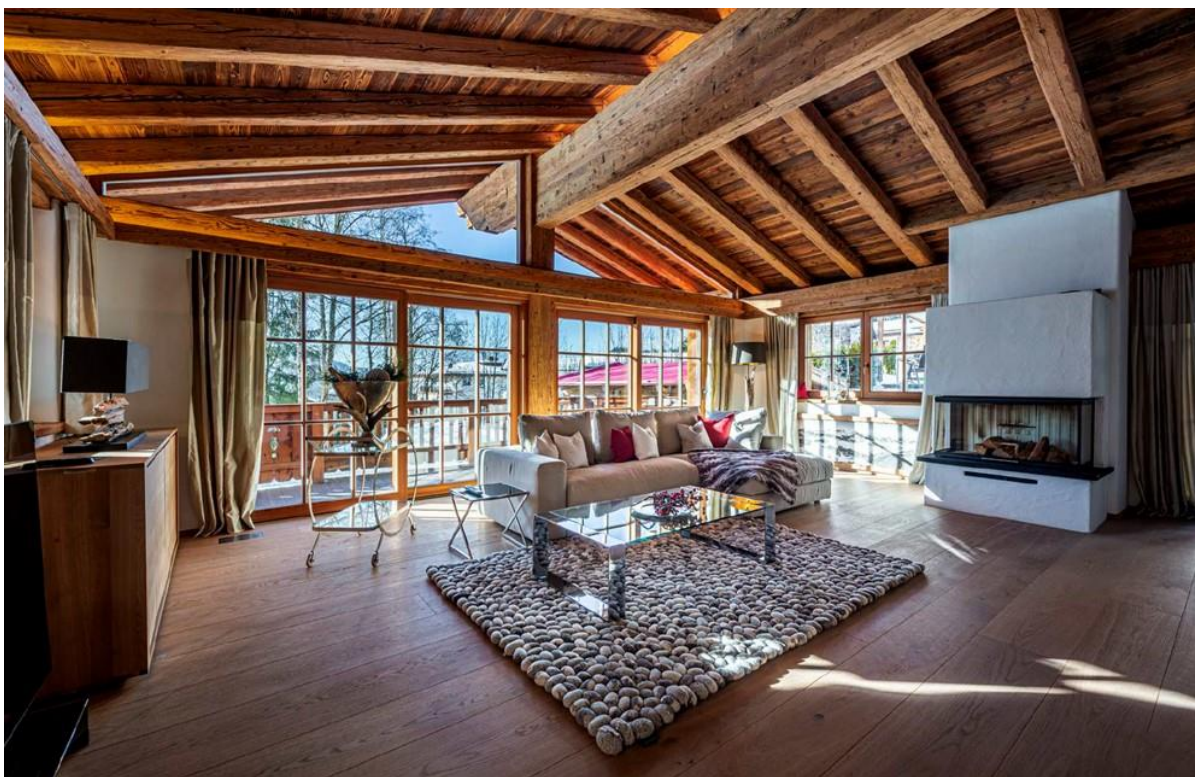
Das Wohnzimmer mit Kamin und Sichtdachstuhl, hell und lichtdurchflutet