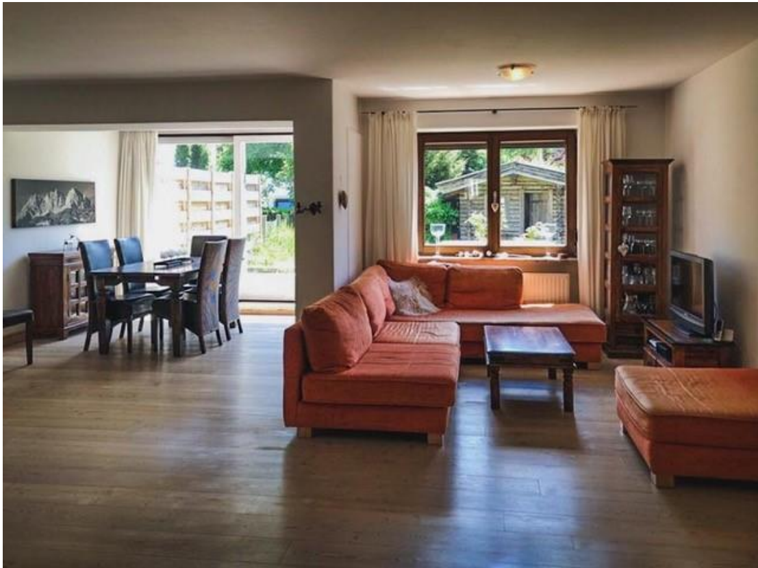
Das Wohnzimmer mit offenem Kamin und hochwertigem Holzboden