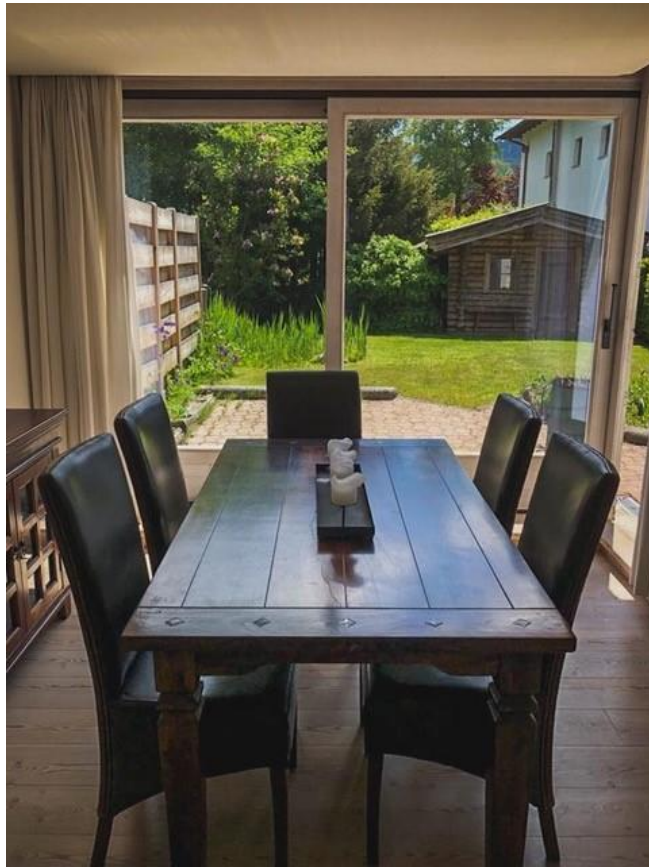
Der lichtdurchflutete Eßbereich mit Blick auf das Gartenhäuschen