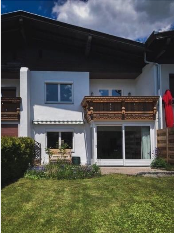
die Hinteransicht vom Gartenanteil aus

Dieses bezaubernde und sehr gepflegte Anwesen ist im Moment teilweise möbliert. Das heißt Sie, könnten nach dem Kauf sofort einziehen.