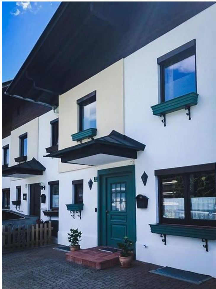
Der einladende Eingangsbereich