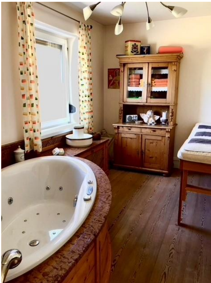
das hochwertige Badezimmer mit Whirlpool und Dusche