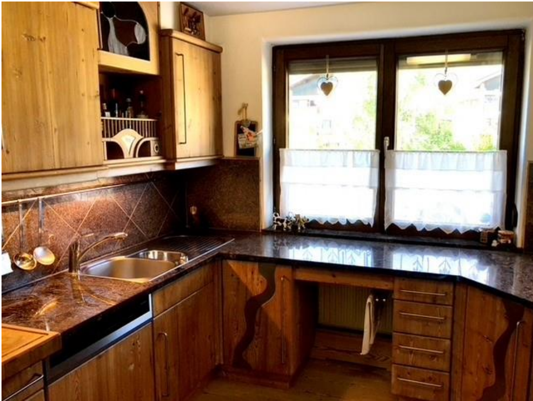
Die Küche: eine massive und kreative Arbeit vom Tischler