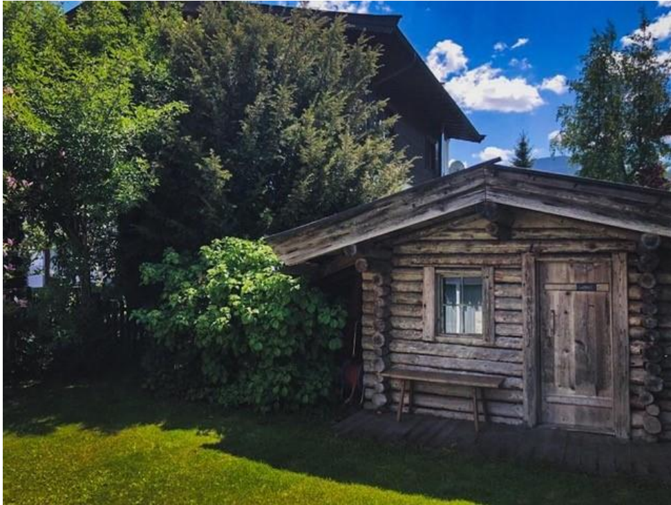
Das Gartenhäuschen für lauschige Abende